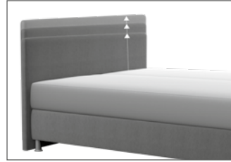
KT 1300 Multimaß H ca. 55-125 cm in 5 cm-Schritten kürzbar