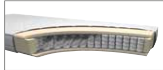
7-Zonen-Tonnentaschenfederkern MA 350 H ca. 24 cm (H2, H3 o. H4)