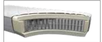
1000-Federn Tonnentaschenfederkern MA 420 H ca. 26 cm (H2, H3, H4 o. H5)