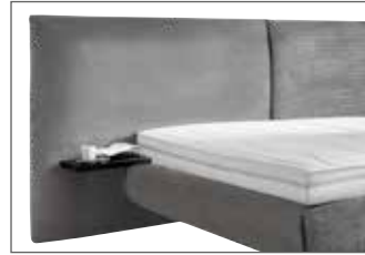
KT 1996 H ca. 129 cm