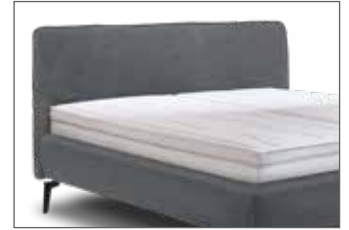
KT 1869 H ca. 116 cm