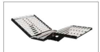
XL-Motor-Variante mit 30 stabile Federholzleisten, Kopf- und Fußteil separat und stufenlos elektrisch per Kabelfernbedienung verstellbar, bis 200 kg belastbar, bei den Breiten 120 und 140 cm sowie bei einer Länge von 220 cm nicht möglich