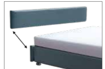
KT 3124 Kopfteil-Blende H ca. 24 cm

Bei den Kopfteilen KT 1857, KT 1869 und KT 1871 ist die Kopfteilhöhe für die Fußhöhe ca. 16 cm angegeben.