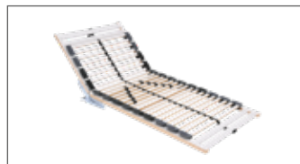
XL-Variante mit 26 flexibel gelagerten Federholzleisten, Kopfteil 4-fach manuell verstellbar, Fußteil aufklappbar, enger anliegenden Leisten und zusätzlichen Verstärkungen