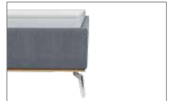
Kubisch mit Sichtholzrahmen Wildeiche geölt H ca. 26 cm

Wählen Sie aus vielen verschiedenen Bezugstoffen.