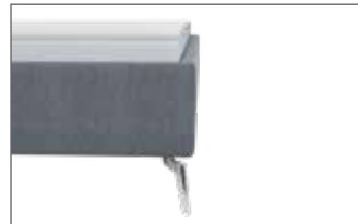
Kubisch ohne Sichtholzrahmen H ca. 24 cm