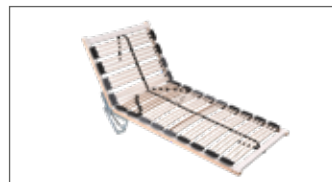
Mit 39 flexibel gelagerten Federholzleisten, beweglichen Kautschuk-Kappen, Kopfteil 4-fach manuell verstellbar, Fußteil aufklappbar