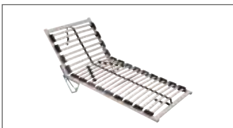
Mit 26 flexibel gelagerten Federholzleisten, Kopfteil 4-fach manuell verstellbar, Fußteil aufklappbar