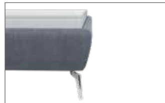
Leicht konisch ohne Sichtholzrahmen H ca. 24 cm