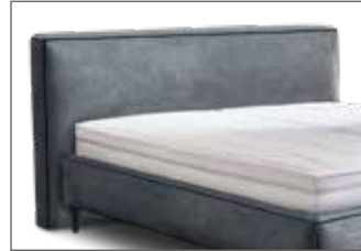
KT 1868 S/M/L H ca. 99/109/119 cm