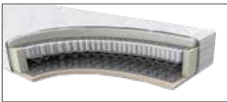
Doppelfederkernaufbau: Luxury-Comfort-Federkern (Bonell) unten, 1000 Federn Tonnentaschenfederkern oben plus Schaumabdeckung MA 734 H ca. 26 cm (H2 o. H3)