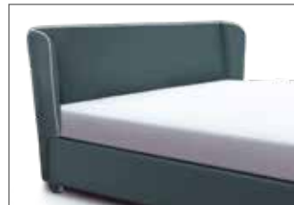
KT 1871 H ca. 107 cm