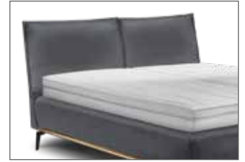
KT 1857 H ca. 106 cm