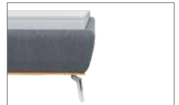
Leicht konisch mit Sichtholzrahmen Wildeiche geölt H ca. 26 cm