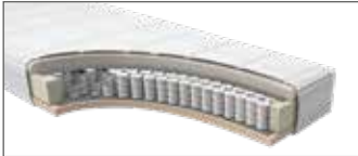
5-Zonen-Tonnentaschenfederkern MA 222 H ca. 21 cm (H2 o. H3)