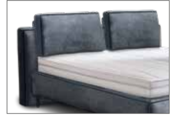
KT 1861 H ca. 90 cm, inkl. 2 losen Rücken- kissen mit Rolle / Höhe ca. 101 cm (nur ab Breite 160 cm möglich)