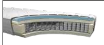
Taschenfederkern mit Geleinlage MA 340 H ca. 26 cm (H2, H3 o. H4)