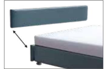
KT 3124 Kopfteil-Blende H ca. 24 cm